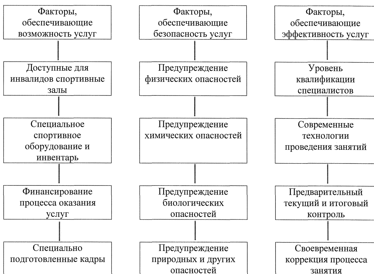
Рисунок 1. Факторы, влияющие на доступность услуг для инвалидов и других маломобильных групп населения на объектах спорта и в учреждениях и организациях, предоставляющих услуги

Понятно, что для обеспечения возможности предоставления и получения услуг для инвалидов и МГН необходимо наличие кадров, имеющих право работать с данным контингентом.